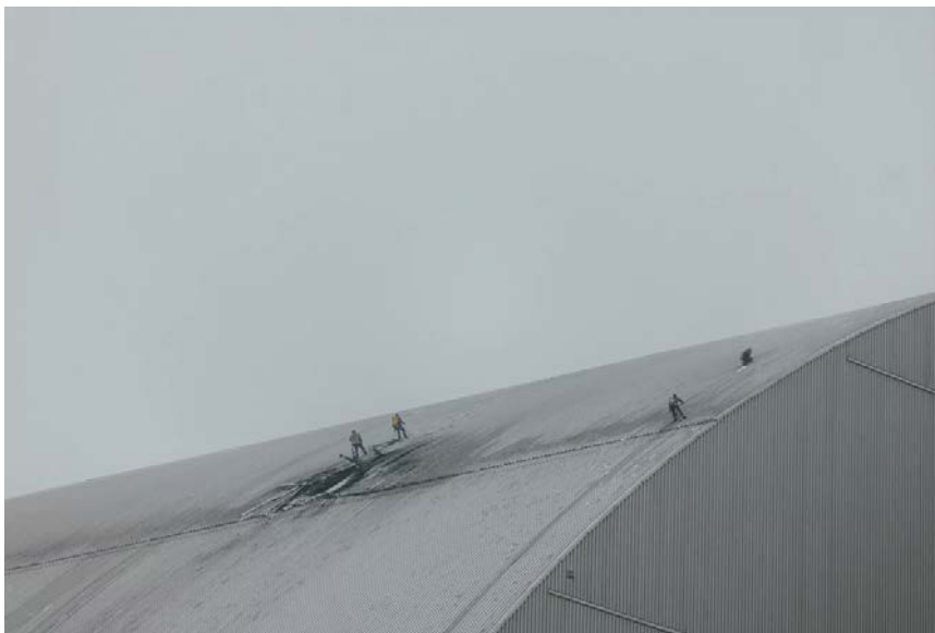
Beschädigte Schutzhülle in Tschernobyl, Ukrainischer Katastrophendienst 2025