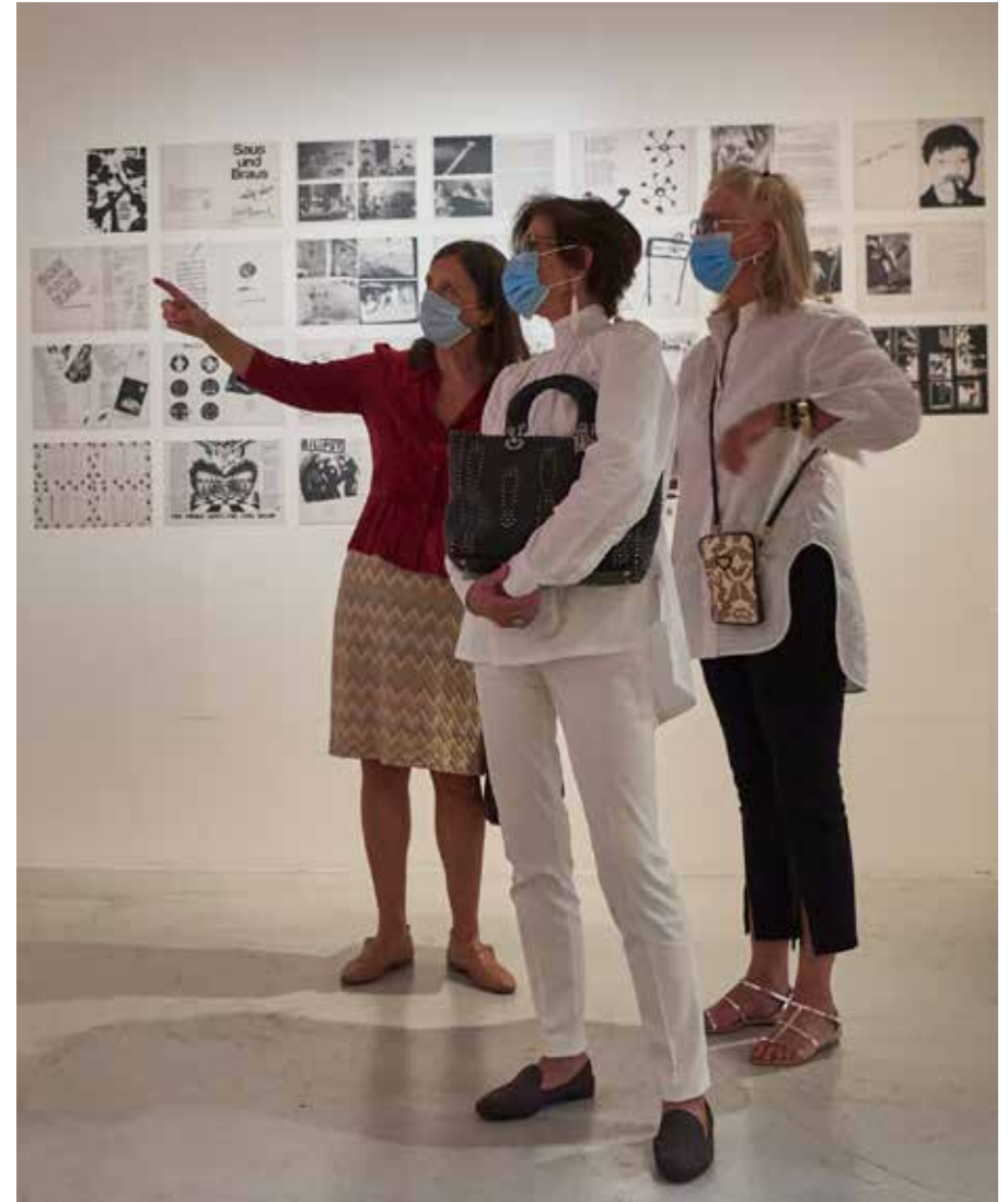
Vernissage «Ausbruch & Rausch»